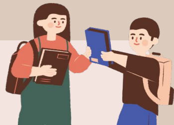
113 學年度部分領域課程雙語教學計畫線上分享會